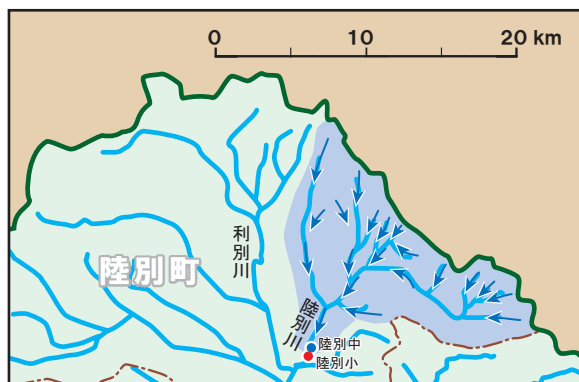
色は、陸別小や陸別中近くの陸別川に流れこむ範囲(流域)。