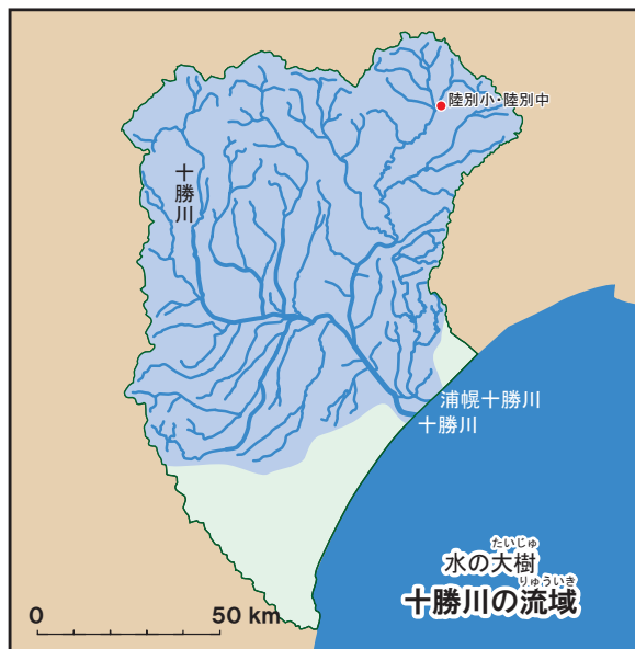
色は、十勝川(浦幌十勝川もふくむ)に流れこむ範囲(流域)。