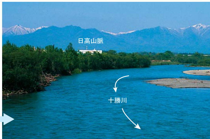
日高山脈に積もった雪も、だんだんとけて川に流れこむ。十勝川中流部。

注意!! …雨が降ると、川の水は多くなります。いつもとは、流れる量のほか、速さも強さもまったくちがいます。