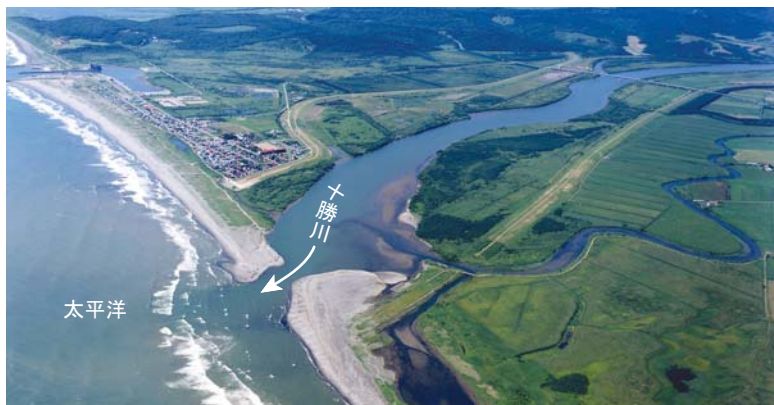
十勝川が海に流れこむ。空から見たところ。

十勝の川に集まった水は太平洋に流れ出ます。十勝川は、浦幌十勝川もふくめると約9,000km 2 の流域から水を集めて、太平洋へ流れ出しています。