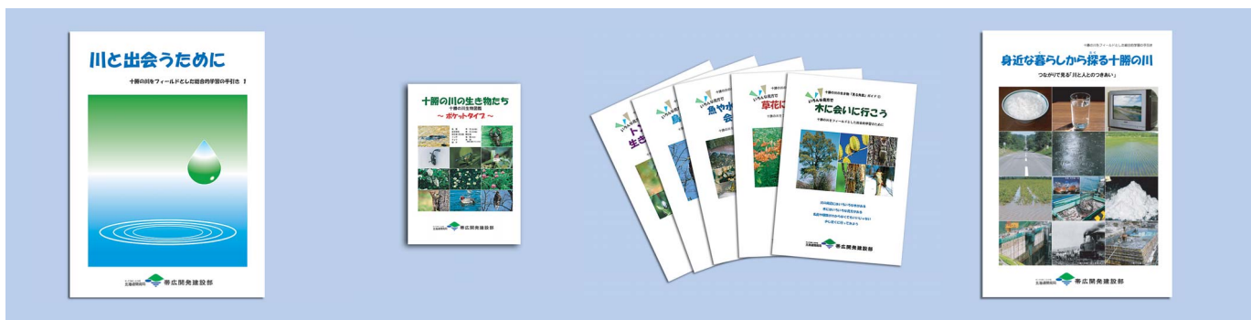
「川と出会うために」