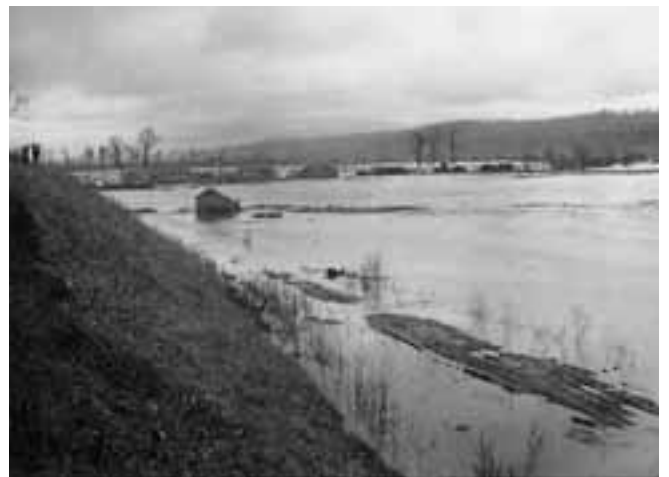
こうずい かいたくち たかしまのうじょう いけだちょう 洪水によって水につかる開拓地。明治44年(1911)、高島農場(池田町)。 (『池田町懐かしのアルバム』より)

また、橋ができるまでは、かんたんには川をわたれません。舟を利用するか、浅いところを探さなければなりません。学校ができた時、川の対岸に住む生徒のために渡船場( p176) がつくられたこともあります。