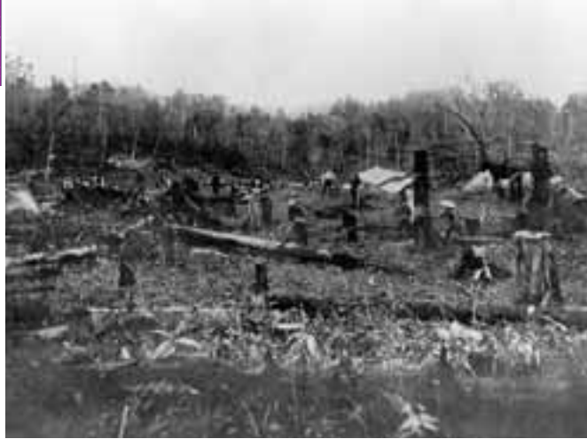
げんしりん かいたく にゅうしょくしゃ しんとくちょうにいらい 原始林を切り開いて開拓する入植者たち(新得町新内: 明治時代の終わりころ)。 (写真: 『十勝川写真で綴る変遷』より)