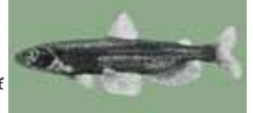
(右) 産卵するために川をのぼるシシャモのオスは黒くなる。