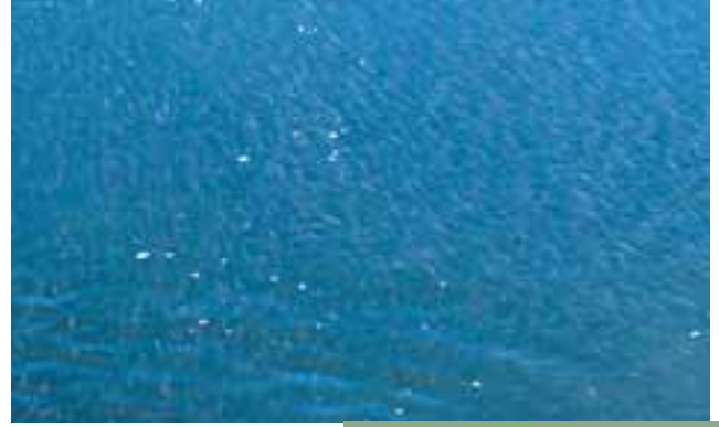
(上) 冬をこすために、川をのぼるウグイの群れ（下頃辺川・浦幌町）。

魚は、始めのうち、アイヌの人と物々交かんで手に入れ、やがて釣りやワナ、網などでつかまえるようになりました。