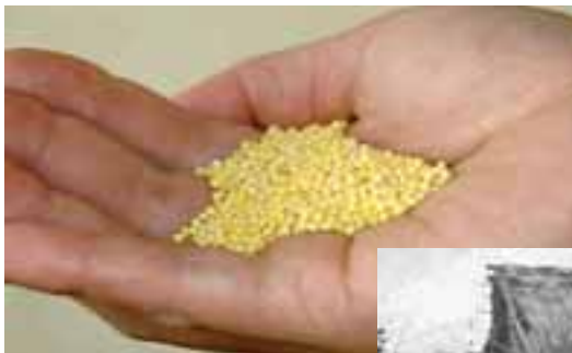
(上) キビ（もちぎび）。栄養は豊富で、今でも米に混ぜてたかれる。