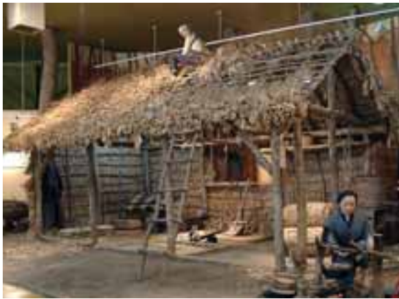
にゅうしょくしゃ ていど 入植者たちは、ある程度落ちつくと、自分たちの手で小屋を建てた。 (幕別町ふるさと館展示: 1)

近くの人たちと力を合わせて井戸をほり、そのそばに共同の風呂を建てたところもありました。