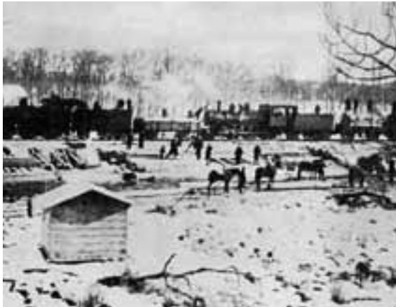
池田停車場構内の建設作業のようす。明治37年(1904)。

明治36年(1903)釧路からの線路が、浦幌までのばされました。十勝に鉄道がやって来たのです。次の年、鉄道は豊頃、さらに池田までのびます。