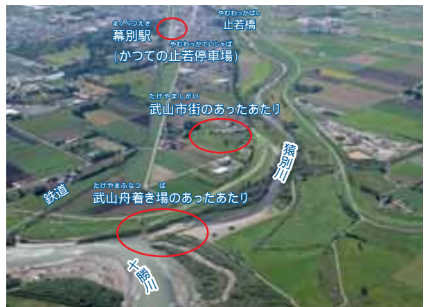
平成17年(2005)の猿別川下流部と幕別市街地。かつての武山市街は十勝川近くにあった。

このように、川舟の役割は小さくなりましたが、川舟すべてが消えたわけではありません。橋がかかっていないところでは、「渡船」がまだまだ活やくしていました(p176)。