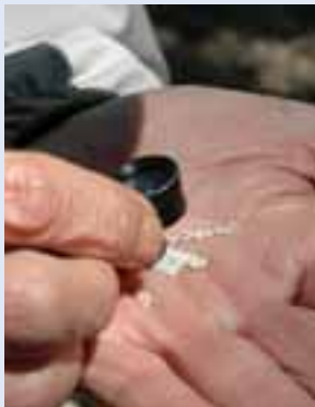
写真：2枚とも帯広百年記念館「地質講座」