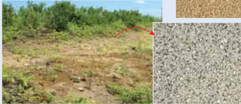
約1万8千年前の恵庭岳からの火山灰層（白っぽい）があるところ（帯広市泉町西）。右は火山灰のアップ。「ごま塩」のような感じ。