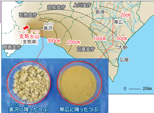
約4万年前、支笏火山の軽石が積もった厚さ。写真は、苫小牧市美沢と帯広に降ったつづのちがいがい。（参考：『地団研専報22十勝平野』より、改変）