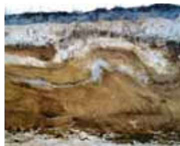
「じょう乱」した火山灰の地層。

本来地層は水平に堆積していますが、寒い時期に水分の多いローム層がこおりついてふくらんだために、その影響を受けて火山灰の地層も乱れたのです。