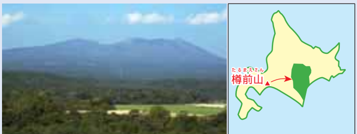
樽前山(千歳市・苫小牧市)

みなさんの学校や家の近くにも、他の土に比べて赤っぽ い土があつたら、少しけずってみて下さい。サラサラと簡 単にくずれるようなら、樽前山の火山灰かも知れません。