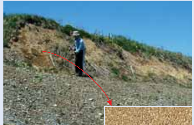
約4万年前の支笏火山灰の地層があるところ（幕別町依田）。右は火山灰のアップ。「おがくず」のような感じ。

茶色っぽい「土」の色ではなく、白っぽくて、その中に点々と黒っぽい（鉱物）が入っています。まるで「ごま塩」のような砂を見つけたら、それは恵庭岳の火山灰なのです。