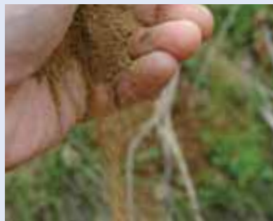
（右）支笏火山灰を手からこぼしたところ。サラサラ。