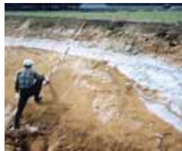
支笏火山灰でできた古砂丘（茶色の地層）の上に、白っぽい恵庭火山灰がふきよせられてたまっている。