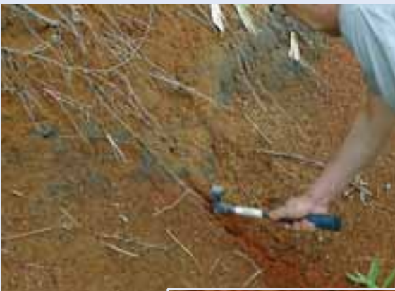
(上)斜面に見られた約8 千年前の樽前火山灰。 (右)そのアップ(清水町 羽帯)。(帯広百年記念館 「地質講座」: 1)