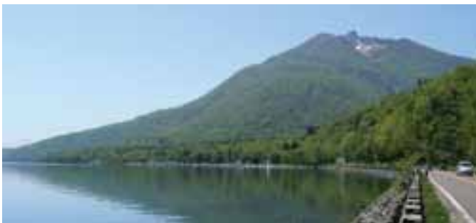
今の恵庭岳。湖は支笏湖。（千歳市）

この噴火でふき出た火山灰は、芽室や帯広など十勝の中部にも厚く積もりました（つづの大きさは帯広で平均0.5mm）。十勝平野の中部には、再び砂漠が広がりました。この砂漠は、数千年間続いたと考えられています。