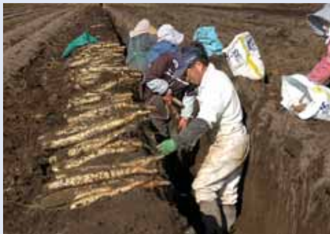
長いもの収穫作業。土の中に深く育った長いもを取るために、人が入る穴をほって収穫する。厚くたまった火山灰からできた土の畑。（帯広市基松町）

川や火山灰のめぐみを受け、火山灰の欠点を補うことで、十勝の畑作は発展してきたのです。