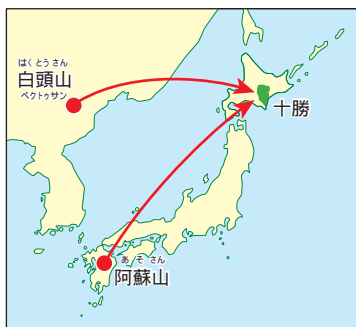
火山灰は、大陸や九州からも飛んできている。