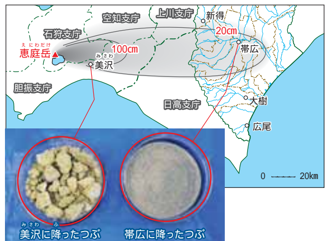
約1万8千年前、恵庭岳の軽石が積もった厚さ。写真は、苫小牧市美沢と帯広に降ったつづのちがいがい。（参考：『地団研専報22十勝平野』より、改変）

やがて、この砂漠の時代が終わり草木が生えてきます。そのころには、十勝に人が住んでいました（p72）。