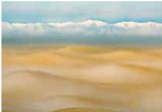
約4万年前、支笏火山灰によって十勝平野の中部から南部は砂漠となり、砂丘ができた。（イメージ図：帯広百年記念館蔵）