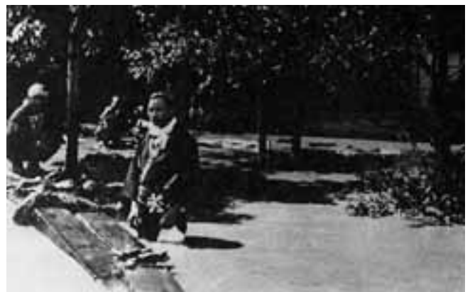
大正11年(1922)の洪水で、水に入って作業する人(池田駅前)。

十勝地方の死者は9人、こわれたり流された家が240軒、水につかったり流された田畑が5,000畝 1 以上にもなりました。