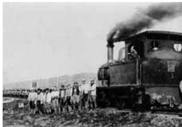
作業をした人たちと、蒸気機関車。左後ろが土運車。

馬は昭和35年（1960）くらいまで、機関車は（ディーゼルも入れて）昭和37年（1962）くらいまで、川の工事で活やくしました。