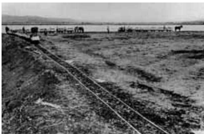
キムウントー沼に土砂を運ぶ馬車。