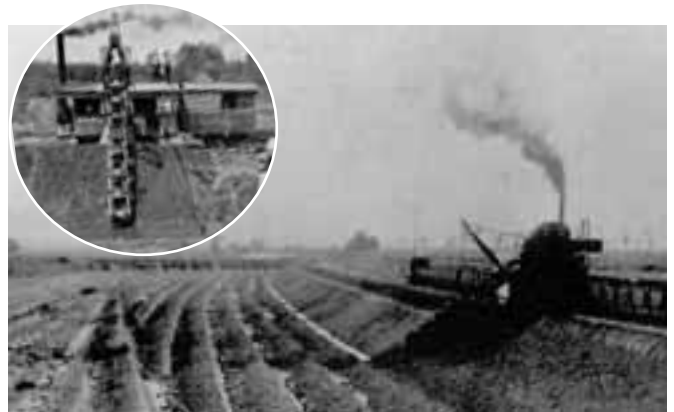
(上) 統内新水路をほるエキスカベーター。(円内) 小型のエキスカベーター。(左) 受刑者が監視されながら働いているところ。

さらに、湿地帯が多かった統内原野(池田・幕別・豊頃)にまたがる平野部の水はけがよくなり、新しく農地をつくりやすくなります。