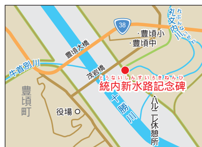
「十勝川統内新水路記念 碑」の位置。豊頃町、茂岩 橋下流の左岸堤防。 礼文内川がもとの十勝川。