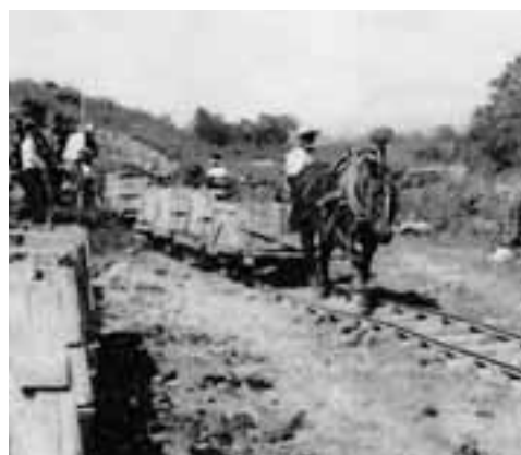
昭和35年（1960）ころまで、馬車によって土砂が運ばれた。