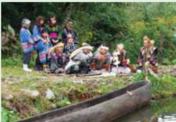
「マレク漁の集い」でおこなわれるカムイノミ。(上士幌町・東泉園)