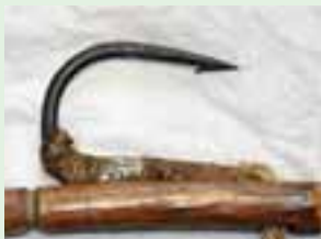
「かえし」のあるカギ。 (幕別町蝦夷文化考古館：1)