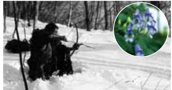
冬の狩り。円内はトリカブト(スルク)の花。根から毒をとる。

弓矢による狩りでは、トリカブト（スルク）という草の根の毒をヤジリ（矢の先）にぬっていました。この毒は何種類かあるトリカブトをどのように混ぜ、ほかに何を入れるのかによってききめがちがい、他人には知られないようにしていたといいます。