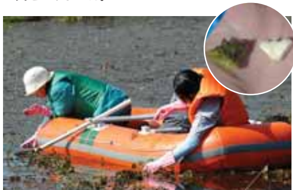
ヒシ(ペカンベ)の実を沼で集める。円内がヒシの実(右は皮をむいたもの)。