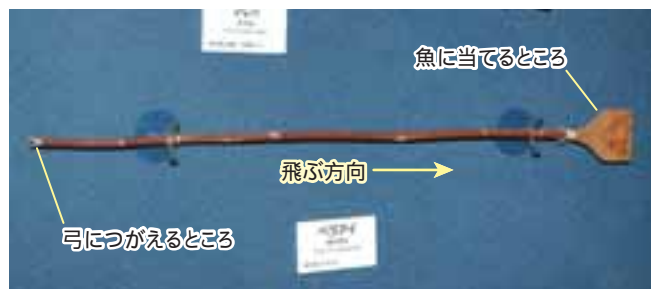
ペラアイ。右の板の部分が前で、魚に当てる場所。(帯広百年記念館)