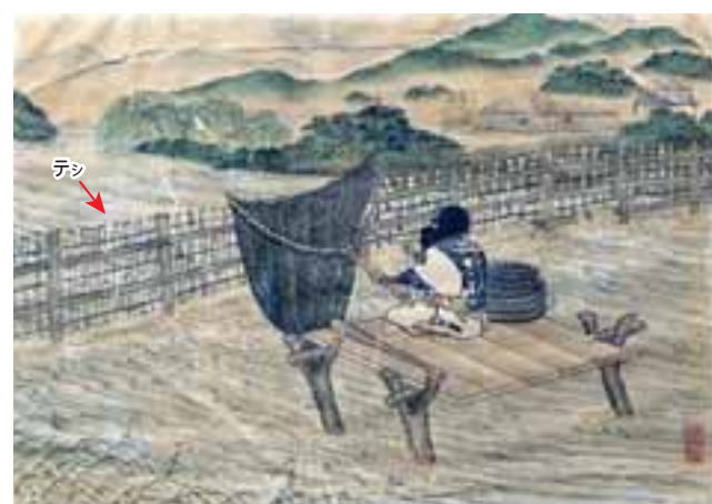
テシによる漁。タモ網ですくい取っている。