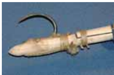
(平澤屏山『蝦夷人マレップにて鮭を捕る図』〔3〕 函館市中央図書館蔵) マレク。(帯広百年記念館)