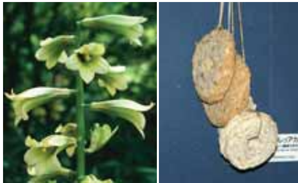
オオウバユリ(トゥレブ)の花と、その鱗茎のせんいで作られた保存食「トゥレブアカム(帯広百年記念館: 2)」。

あるいは、オオウバユリは「トゥレブ」と呼ばれ、その鱗茎（球根のようなもの）からでんぷんをとり、また、保存食として「トゥレブアカム」を作りました。