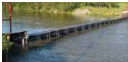
現在、人工ふ化( p236)のために猿別川でサケをつかまえるしかけも「ウライ」と呼ばれる。ただし、かなりの大きさと、V字形ではない。