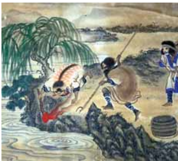
マレクによる漁。子どもがたいまつをかざしている。

下がります。魚の重みでカギが上向きにくいこむので、あばれてもはずれません。( p 120)