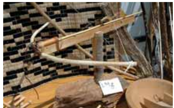
復元された、しかけ弓「アマツポ」。(上士幌町・東泉園)

そのほか、エサをとろうとすると重しが落ちるしかけ、エサをとるためにジャンプすると首が引っかかるような木の又を利用したしかけ、通り道に輪を作っておいて走りぬけようとした動物をとるしかけなどがありました。