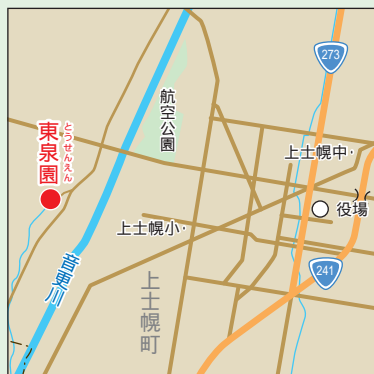
東泉園の位置。上士幌町字上音更。