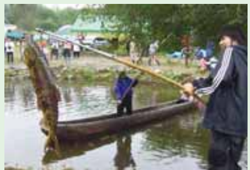
カギにささったサケは、マレクにぶら下がり、重みではずれない。(上士幌町・東泉園)