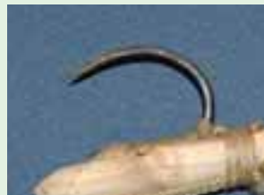
「かえし」のないカギ。 (帯広百年記念館：2)