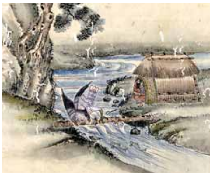
川では魚だけでなくワシ りょう もおこなわれた。丸木に生きた魚を結びつけておき、エサをとりに来たワシをつかまえる。(『蝦夷島奇観』より 帯広百年記念館蔵：2)

伝統的なアイヌ文化では、ヒエやアワなどの畑も作られていましたが、基本的には自然の中で、植物採集・魚とり・狩りなどをすることによって食べ物を得ていました。