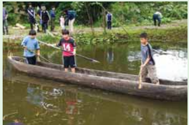
「マレク漁の集い」。丸木舟(チブ)に乗って、池に放されたサケをマレクでつこうとする子どもたち。(上士幌町・東泉園)

マレクにかかったサケを持ち上げる時、サケの「命の重み」をきくと感じられることでしょう。