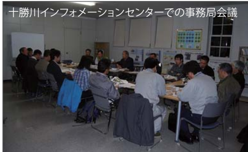
十勝川インフォメーションセンターでの事務局会議