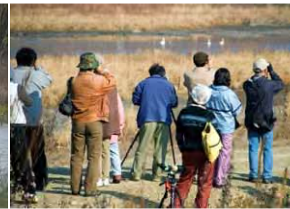
整備後利活用イメージ写真 (バードウォッチング)