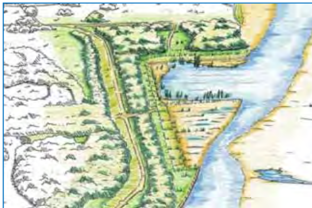
整備後イメージ図