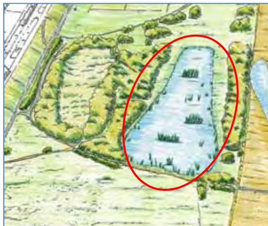
整備後イメージ図