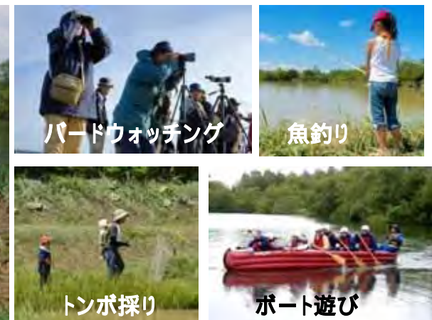
整備後利活用イメージ写真