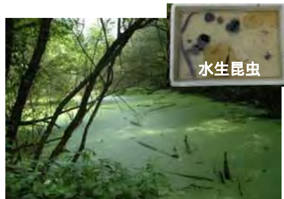
整備後イメージ写真 (保全される樹林内の水域)