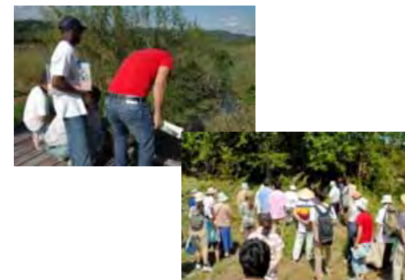
整備後利活用イメージ写真 (河川環境観察・環境教育)