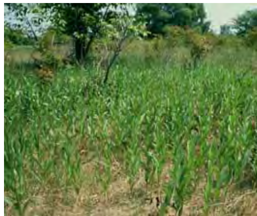
整備後イメージ写真