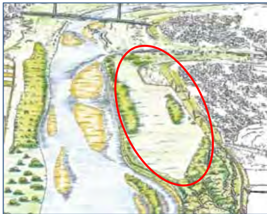
整備後イメージ図