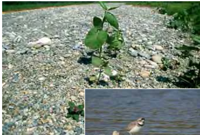
整備後 イメージ写真