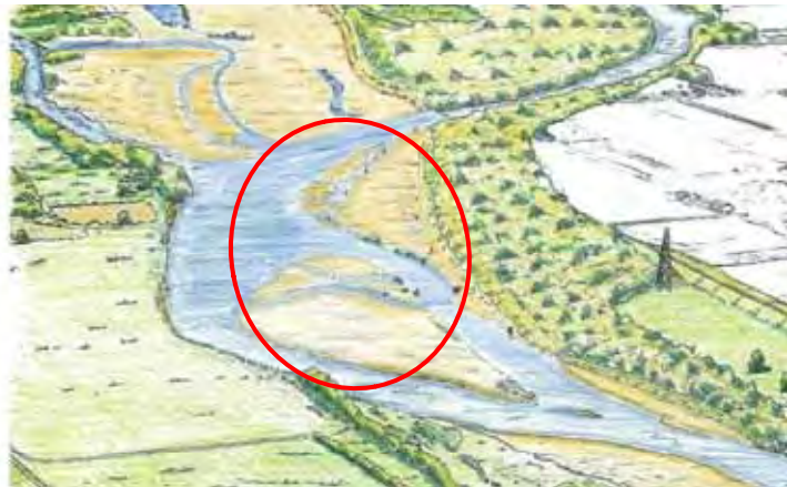
整備後イメージ図