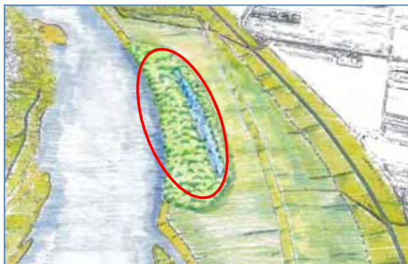
整備後イメージ図