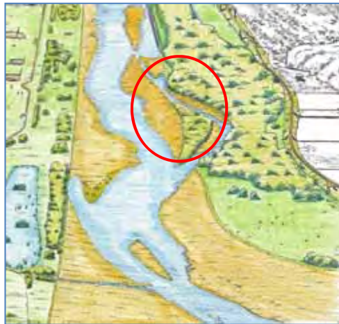
整備後イメージ図