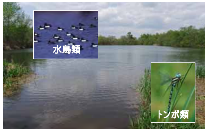
整備後イメージ写真