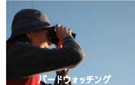
バードウォッチング