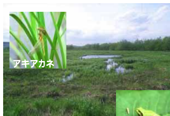
整備後イメージ写真