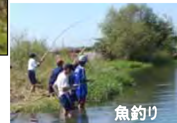
整備後利活用イメージ写真