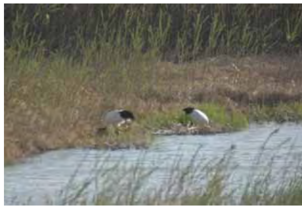
整備後イメージ写真