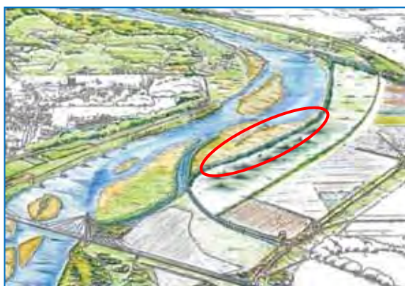
整備後イメージ図