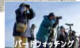
バードウォッチング