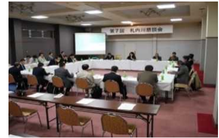
懇談会開催の状況(第8回 H28.3)