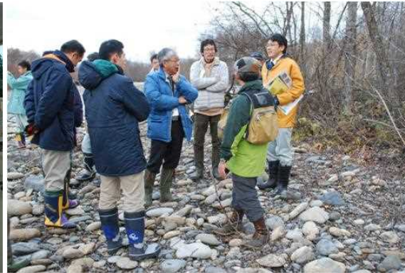
自然環境WG～礫河原再生に伴うモニタリングの実施、等