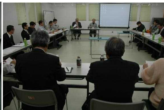
水辺利活用・地域活性WG～利用や観光に関するアイデアだし、等