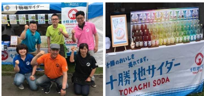
イベントでの様子