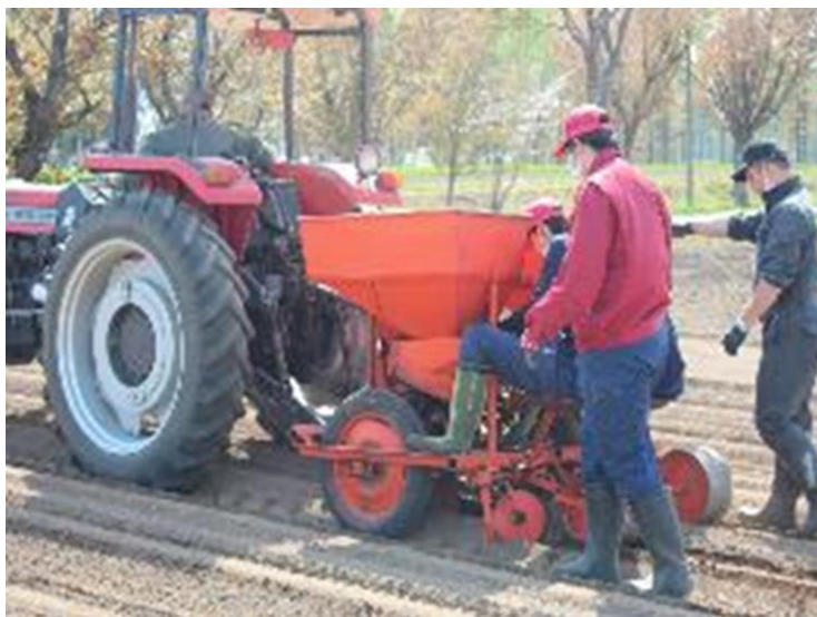
モデル農場での研究から持続可能な農業の実現へ