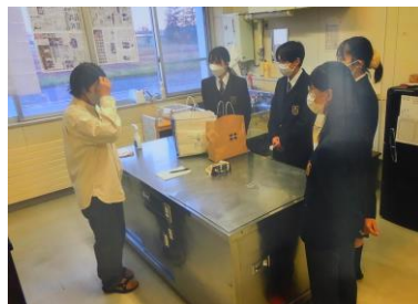
洋菓子店との打合せ

焼きドーナツは、生地豆腐を使ったカロリー控えめなものや薄力粉・バターを使ったものなど試作を重ねながら、キレイ豆を使った焼きドーナツの試作品が完成しました。