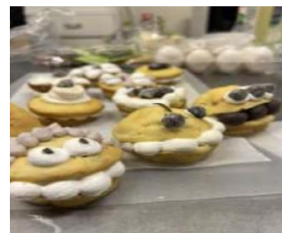
試作した焼きドーナツ