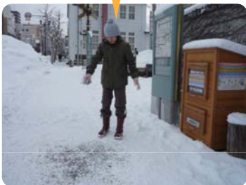
砂まきをしている様子