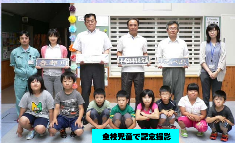
全校児童で記念撮影