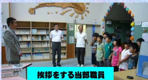
挨拶をする当部職員