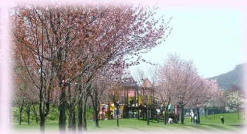
尻別川桜つつみ 開花時期の様子