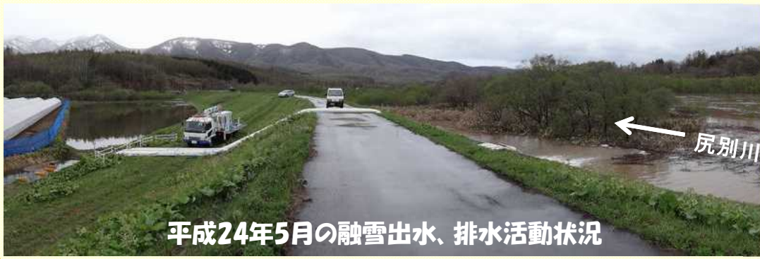
平成24年5月の融雪出水、排水活動状況

平成24年5月には、融雪と降雨により尻別川が増水し、堤防のすぐ下まで水位が上昇しました。一部の田畑では雪解け水が川に流れなくなり農地が冠水しました。このため蘭越町からの要請を受け、小樽開発建設部の排水ポンプ車が出動し、排水活動を行いました。