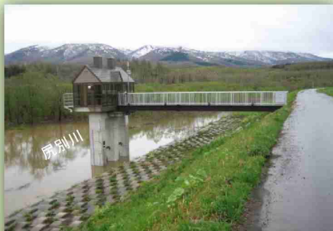
平成24年5月4日 増水時の三浦樋門

しかし、川の水が高くになると、川から逆流してしまいます。そうなる前に樋門の扉をしめ、市街地や田畑に川の水が逆流しないようにしています。