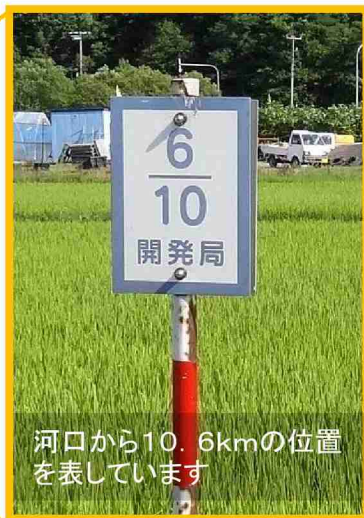
河口から10.6kmの位置を表しています