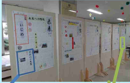
蘭越中学校祭での壁新聞の様子→