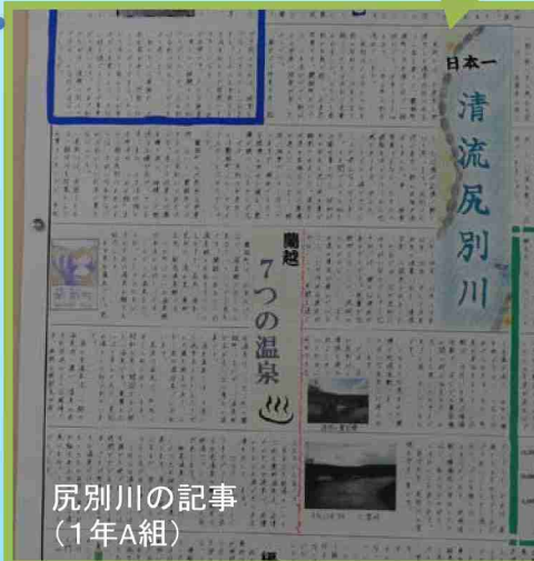
尻別川の記事(1年A組)