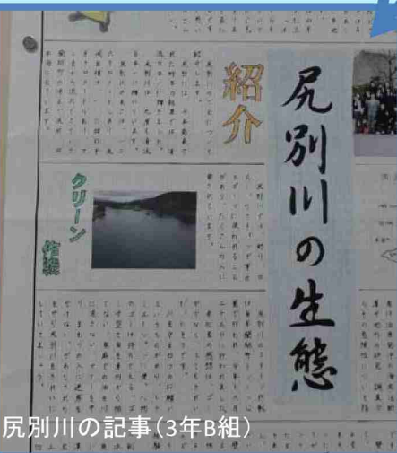
尻別川の記事(3年B組)