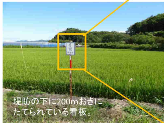
堤防の下に200mおきにたてられている看板。

これらの数字は航空写真の撮影や日々のパトロール、河川工事などで位置を把握するときに使います。尻別川を利用される皆さんも散歩やジョギングなどで目安にはいかがでしょうか。