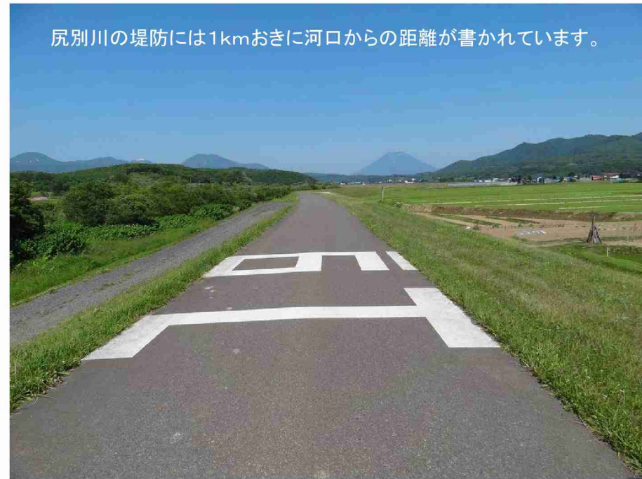
尻別川の堤防には1kmおきに河口からの距離が書かれています。

また、住宅街や畑、田んぼ側に目を向けると、「分数」がかかれた小さな看板が200mおきに設置されています。この看板も河口からの距離が書いてあり、たとえば下の写真の「6/10」は河口から10.6kmの位置にあることを示しています。