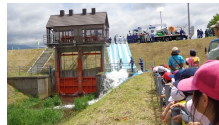
排水ポンプ車訓練