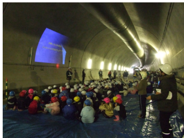
トンネル内の現場見学会のイメージ (他の工事箇所の例)