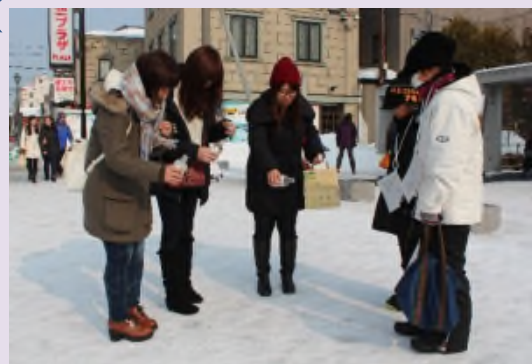
▲観光客に直接砂詰めペットボトルを手渡し、砂まきの効果を説明し、砂まきへの協力をお願いする。