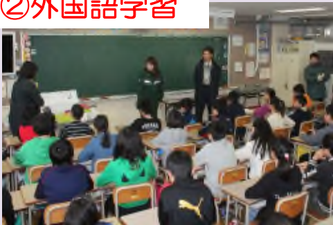
▲授業で外国語の挨拶、自己紹介の仕方を練習