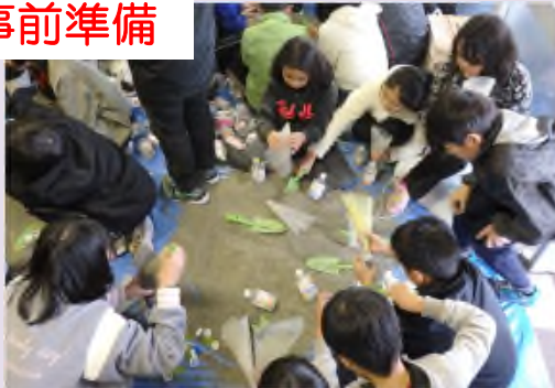
▲児童が自ら砂を詰めペットボトルを製作 (平成29年10月30日実施)