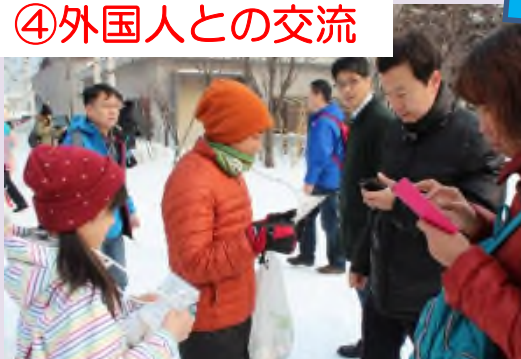
▲外国人観光客へ外国語で声をかけ、自己紹介と転倒防止の呼びかけ