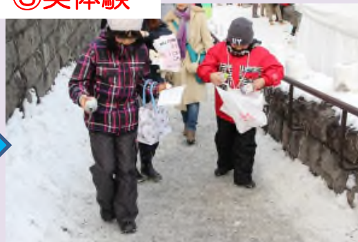
▲通学路に自ら砂をまき効果を体験