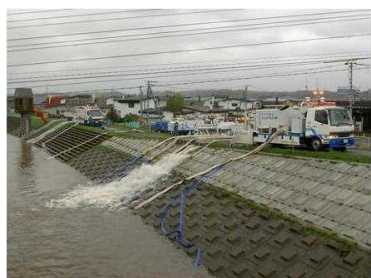
H18.10 低気圧による大雨 内水排除作業支援(美幌町) [自治体支援]