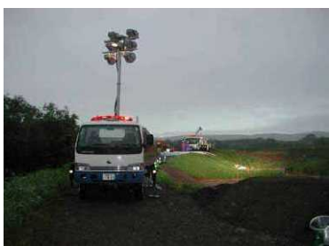
H16.8 台風10号(標茶町) 内水排除作業支援 [自治体支援]