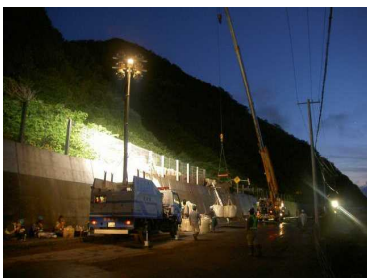
H22.7 一般国道229号(島牧村) 土砂崩落箇所の復旧作業支援