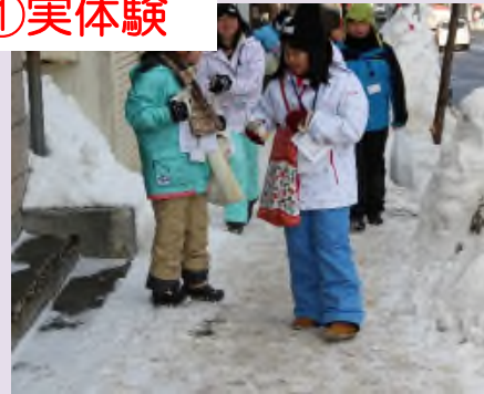
▲通学路に自ら砂をまき効果を体験 ※写真は、平成30年2月5日の様子。