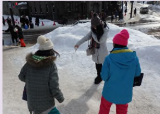
▲観光客に直接砂詰めペットボトルを手渡し、砂まきの効果を説明し、砂まきへの協力をお願いする。※写真は、平成30年2月5日の様子。