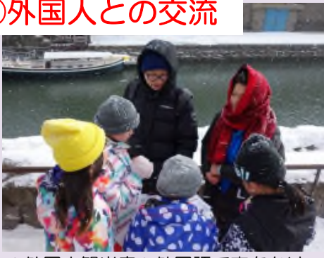
▲外国人観光客へ外国語で声をかけ、自己紹介と転倒防止の呼びかけ ※写真は、平成30年2月5日の様子。