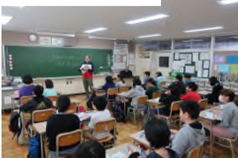
▲外国語の授業状況 ※写真は、平成31年1月23日の様子。