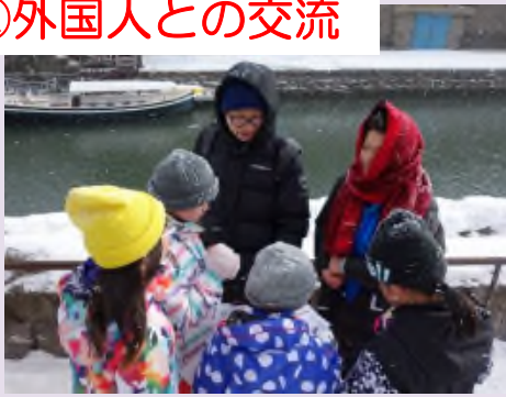
▲外国人観光客へ外国語で声をかけ、 自己紹介と転倒防止の呼びかけ ※写真は、平成30年2月5日の様子。