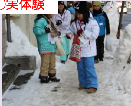
▲通学路に自ら砂をまき効果を体験 ※写真は、平成30年2月5日の様子。