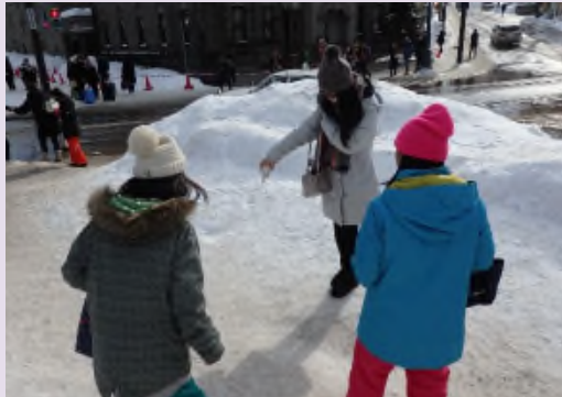
▲観光客に直接砂詰めペットボトルを手渡し、 砂まきの効果を説明し、砂まきへの協力をお 願いする。※写真は、平成30年2月5日の様子。