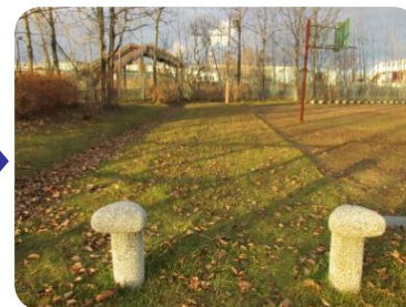
危険な木道を撤去