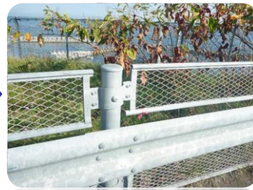
損傷した転落防止柵を補修