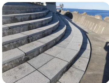
親水護岸階段の貼石の浮きを補修