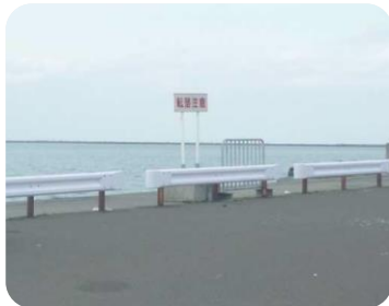
亡失していたガードレールの復旧