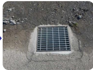
損傷したグレーチングの取り替え