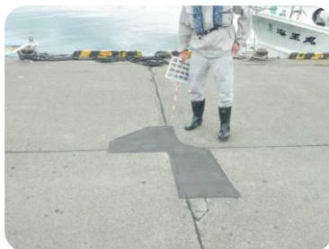
エプロン舗装の段差を解消