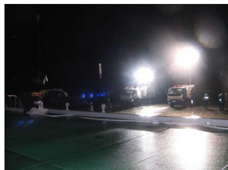
H23.3 東日本大震災(福島県相馬市) 広域防災フロント派遣に伴う作業支援