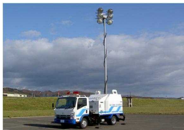
全 景(照明ポール伸長時)