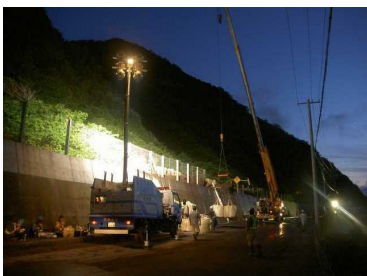
H22.7 一般国道229号(島牧村) 土砂崩落箇所の復旧作業支援