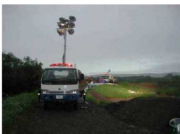
H16.8 台風10号(標茶町) 内水排除作業支援 [自治体支援]