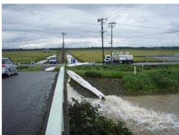
H22.8 低気圧による大雨 内水排除作業支援(芦別市) [自治体支援]