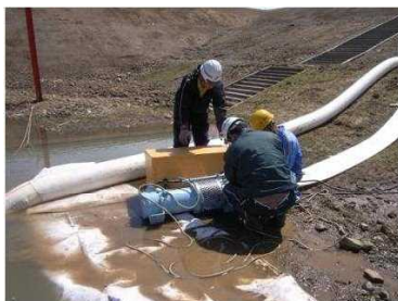
排水ポンプ設置作業