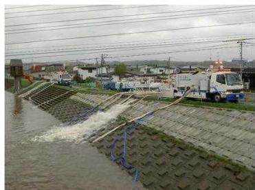
H18.10 低気圧による大雨 内水排除作業支援(美幌町) [自治体支援]