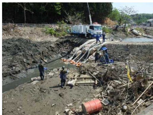
H23.3 東日本大震災(宮城県東松島市) 自衛隊による捜索活動の支援のため 浸水箇所の緊急排水作業を実施 [自治体支援]