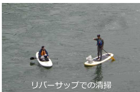
リバーサップでの清掃