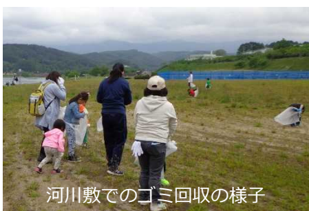
河川敷でのゴミ回収の様子