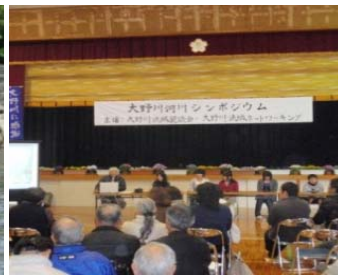
シンポジウムの開催