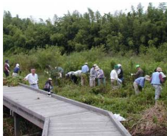
ビオトープの整備