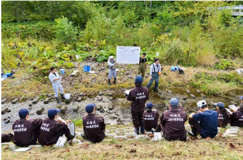
水質調査結果の説明