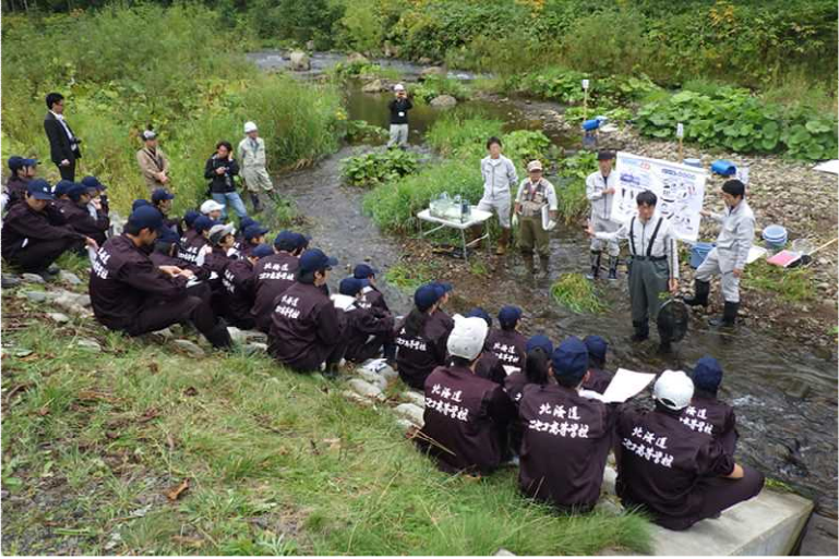
ルベシベ川での環境調査