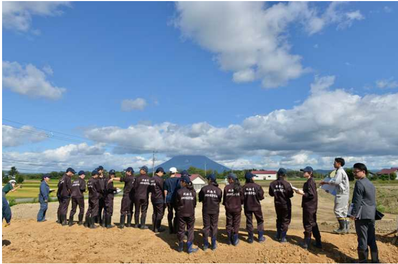
整備実施中のほ場見学