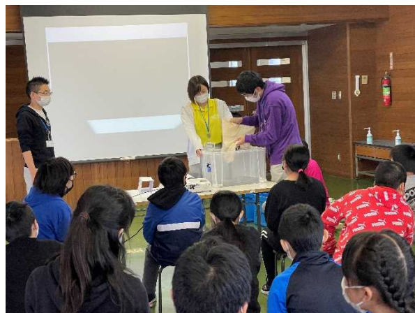
昨年度（令和3年度）開催状況