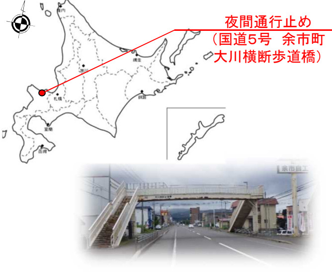
【横断歩道橋位置図】