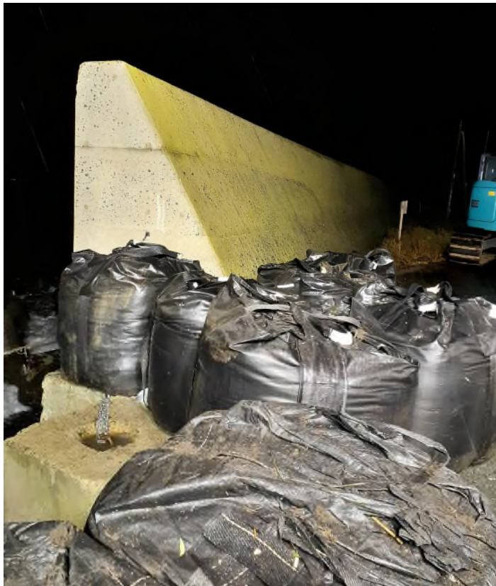
国道 229 号 波浪による路肩洗掘 対策状況