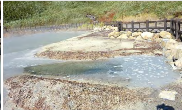
湯面を覆う「黄色球状硫黄」は学術的に貴重。

Oyunuma is a hot water marsh located in Yumoto Hot Springs in Rankoshi-cho, Isoya-gun, Hokkaido. The source of the hot springs is Oyunuma hot water marsh. It is a hot water marsh, which is 50 m from east to west. There is a promenade arranged around the hot water marsh, by which you can walk around it in 3 or 4 minutes. The yellow flowers of sulfur floating on the surface of the hot spring source are called spherical sulfur, which is academically very precious. White steam and the smell of sulfur create a distinctive atmosphere. Oyunuma hot water marsh is the most popular sightseeing spot in Niseko area, where you can enjoy the natural beauty that changes from season to season.