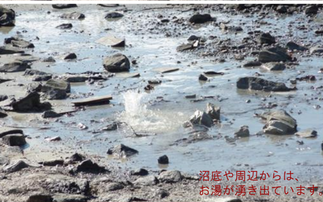
沼底や周辺からは、お湯が湧き出ています。