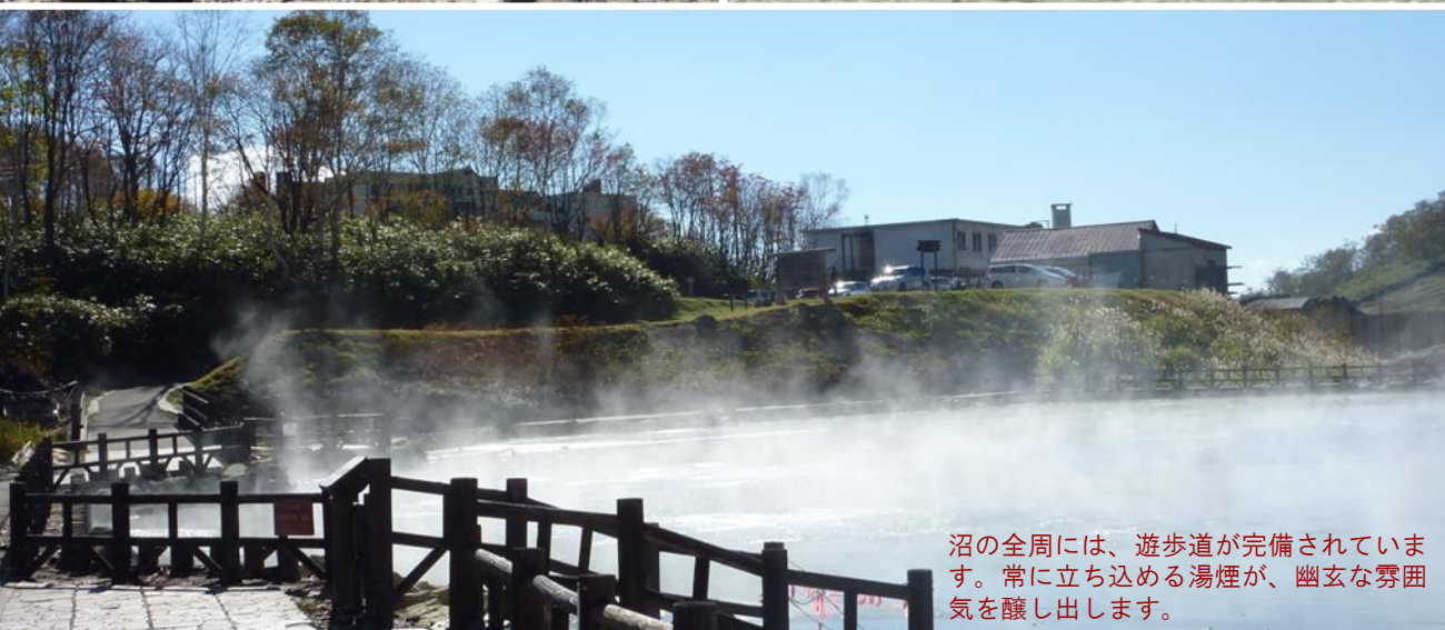
沼の全周には、遊歩道が完備されています。常に立ち込める湯煙が、幽玄な雰囲気醸し出します。

豊かな自然に囲まれた、北海道はニセコ積丹小樽海岸国定公園内のニセコ連峰のほぼ真ん中に、硫黄の臭い立ち込め、湯煙たなびく大湯沼があります。大湯沼は、蘭越町に存し、ニセコの温泉の源泉となっています。今回は、そんな蘭越町の景勝地・大湯沼をご紹介します。