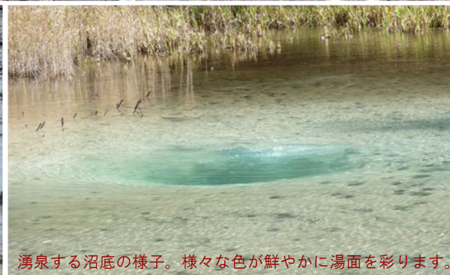
湧泉する沼底の様子。様々な色が鮮やかに湯面を彩ります。