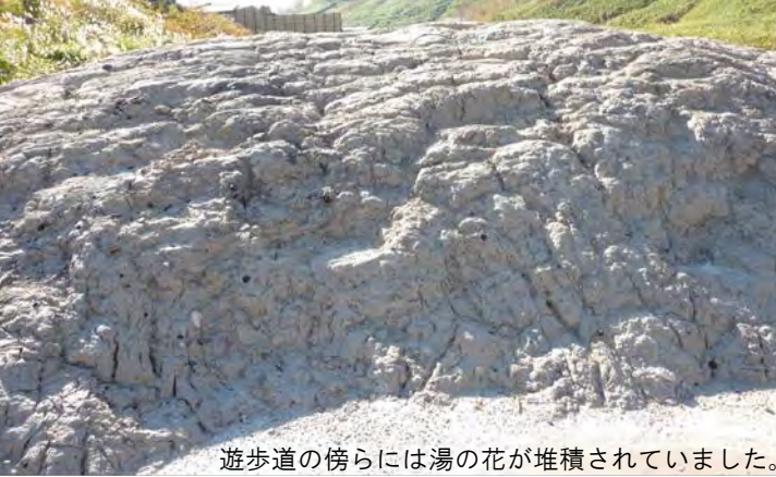
遊歩道の傍らには湯の花が堆積されていました。