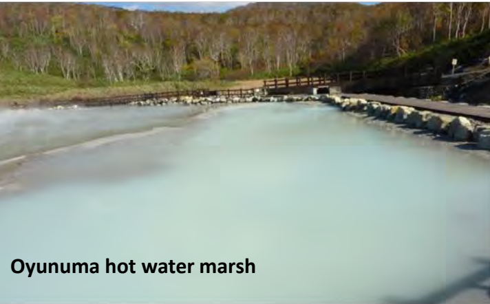
Oyunuma hot water marsh

Oyunuma is a hot water marsh located in Yumoto Hot Springs in Rankoshi-cho, Isoya-gun, Hokkaido. The source of the hot springs is Oyunuma hot water marsh. It is a hot water marsh, which is 50 m from east to west. There is a promenade arranged around the hot water marsh, by which you can walk around it in 3 or 4 minutes. The yellow flowers of sulfur floating on the surface of the hot spring source are called spherical sulfur, which is academically very precious. White steam and the smell of sulfur create a distinctive atmosphere. Oyunuma hot water marsh is the most popular sightseeing spot in Niseko area, where you can enjoy the natural beauty that changes from season to season.