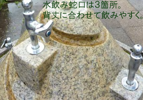
水飲み蛇口は3箇所。背丈に合わせて飲みやすく。