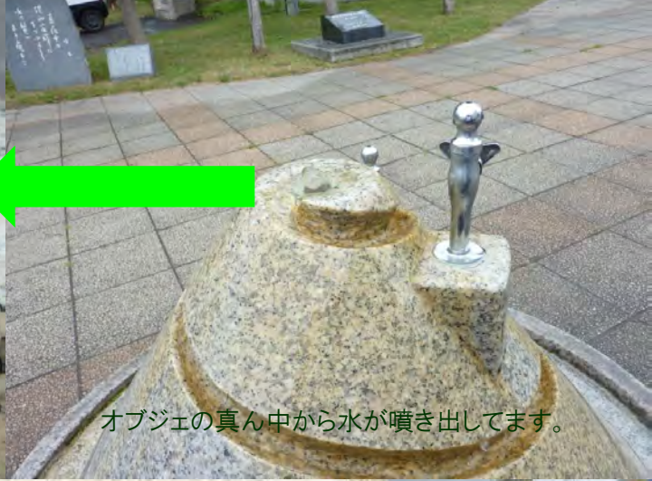
オブジェの真ん中から水が噴き出てます。