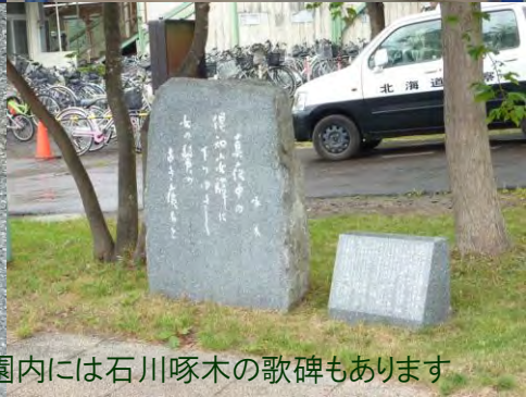
公園内には石川啄木の歌碑もあります