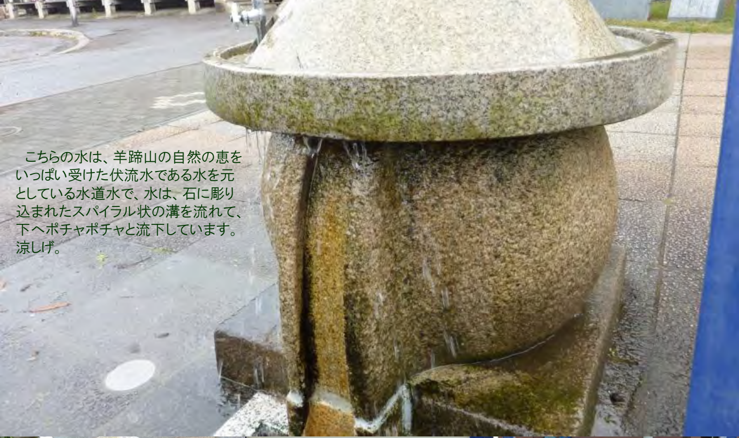
こちらの水は、羊蹄山の自然の恵をいっぱい受けた伏流水である水を元としている水道水で、水は、石に彫り込まれたスパイラル状の溝を流れて、下へポチャポチャと流下しています。涼しげ。