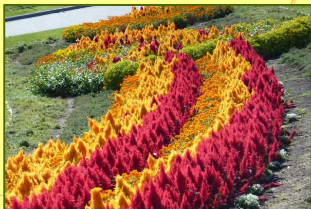
秋の花「ケイトウ」が鮮やかに咲いていました。