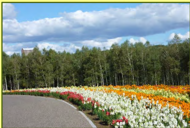
自然いっぱいの公園です！

道の駅の裏手にある「ルスツふるさと公園」には、季節の花を集めた広大な「フラワー園」、「デイキャンプ場」、遊具を備えた「わんぱく広場」があり、楽しめます♪