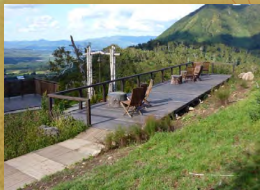
展望台には、おしゃれなイスが。 ここにすわると真正面に羊蹄山が見えます。