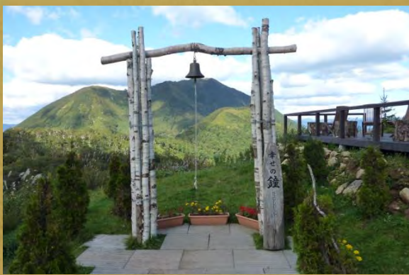
山頂にある「幸せの鐘」。 きれいな鐘の音が響き渡ります♪