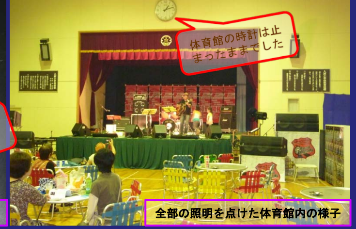
全部の照明を点けた体育館内の様子