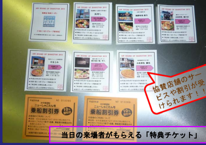
当日の来場者がもらえる「特典チケット」