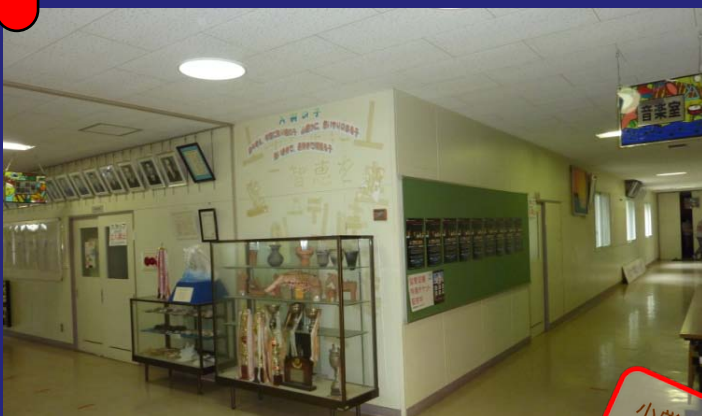
旧入舸小学校内。写真の右奥が体育館。

～ 「AIR SOUND OF SHAKOTAN 2013」の様様を紹介します！！～