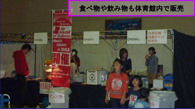
食べ物や飲み物も体育館内で販売