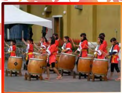
カルデラ太鼓につづき、太鼓の 共演2 羊蹄太鼓の演奏