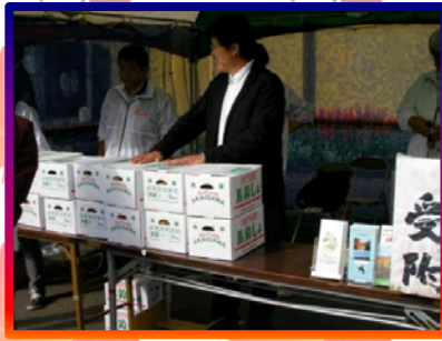
限定100箱のじゃがいも10Kg500円販売！