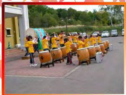
開会式につづき、太鼓の共演1 カルデラ太鼓の演奏

会場の赤井川村 山村活性化支援センターはキロロリゾートの入り口の向かいにあります。モダンな素敵な建物です。