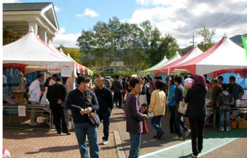
会場内は、大変なにぎわいぶりでした。