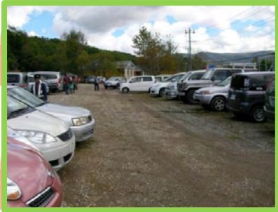
393号すぐ脇に会場直結の臨時駐車場も完備

そして完売！……だったのですが、実はこのあと、あまりの人気ぶりに何十食か追加販売されました！