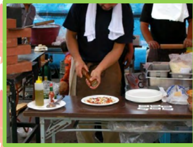
赤井川村の民宿「あったべや」出店での焼きたてピザ。その場で焼きたて！