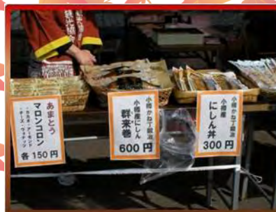
小樽の特産物の販売