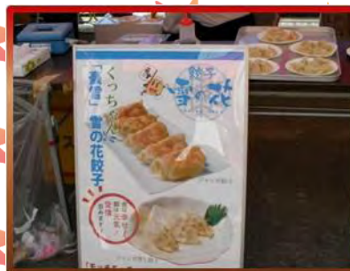
倶知安の名物 豪雪うどんシリーズより新製品、豪雪「雪の花餃子」。もちぱり食感が最高！