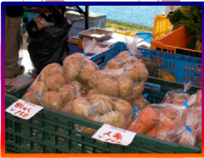
もちろん赤井川村の特産物も販売！