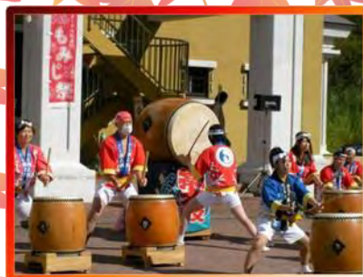
午後に入り、太鼓の共演3 おたる潮太鼓の演奏