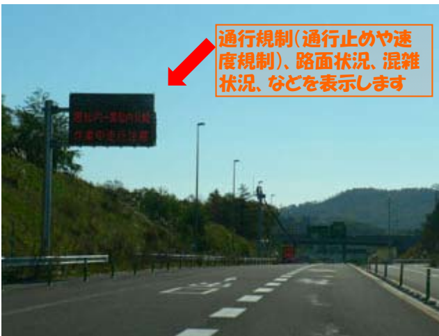
◆道路情報提供装置（道路情報板）