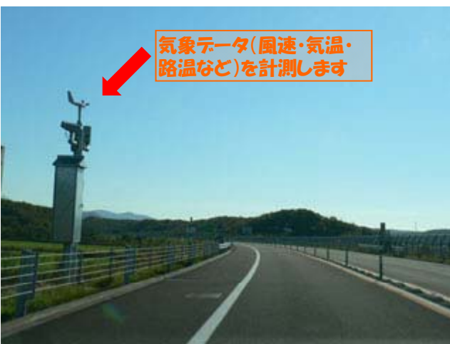
◆道路情報収集装置（気象観測装置）