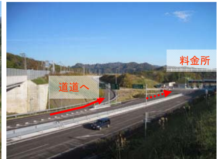
○オフランプから出ます