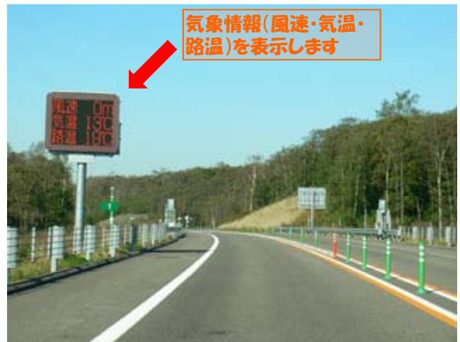
◆道路情報提供装置（気象情報板）