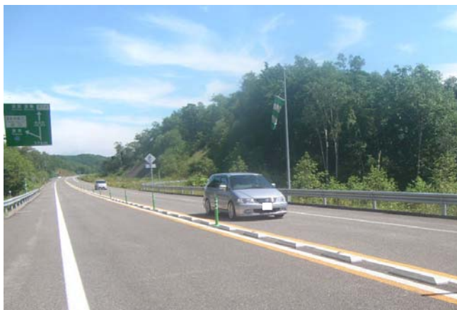
黒松内新道本線(起点黒松内南ICに向け) H22.8月

これにより、新たに北海道縦貫自動車道と後志地域が直結し、函館・八雲や室蘭・伊達方面との地域交流の活性化に寄与するとともに、黒松内町などでは伊達市の高次医療施設へのアクセス性が向上されました。