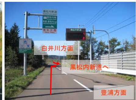
○オンランプから入ります