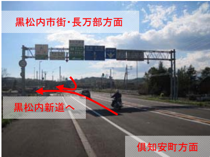
○国道5号と出入りできます