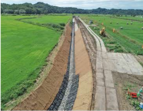
産土地区(排水路施工状況)

また、基幹農業水利施設の機能診断調査及び適切に維持更新していくための調査等を進めます。