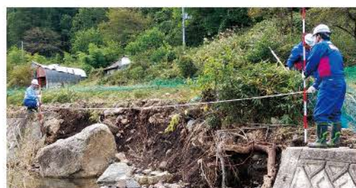
台風19号に伴う豪雨災害 宮城県(令和元年10月) 【留萌管外の災害支援】TEC-FORCE派遣