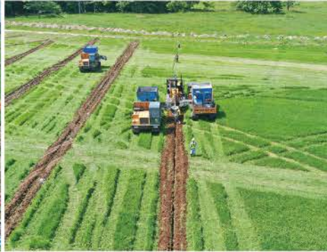
産土地区(暗渠施工状況)