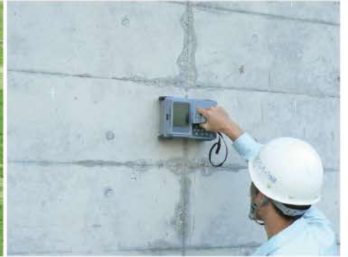
水利施設 機能診断調査状況