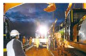
留萌統計最大降水量を更新した平成30年7月豪雨 【留萌管内の災害対応】