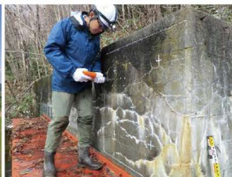
水利施設 機能診断調査状況