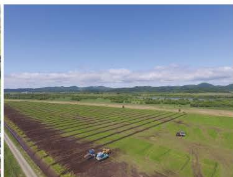
産土地区(暗渠施工状況)