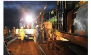
留萌統計最大降水量を更新した平成30年7月豪雨 【留萌管内の災害対応】