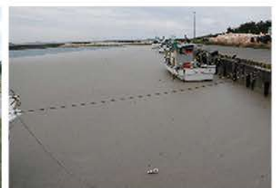
福徳岡ノ場噴火に伴う軽石漂着被害対応 沖縄県(令和3年11月) 【留萌管外の災害支援】TEC-FORCE派遣