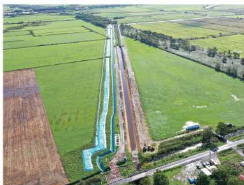
産土地区(排水路施工状況)

また、基幹農業水利施設の機能診断調査及び適切に維持更新していくための調査等を進めます。