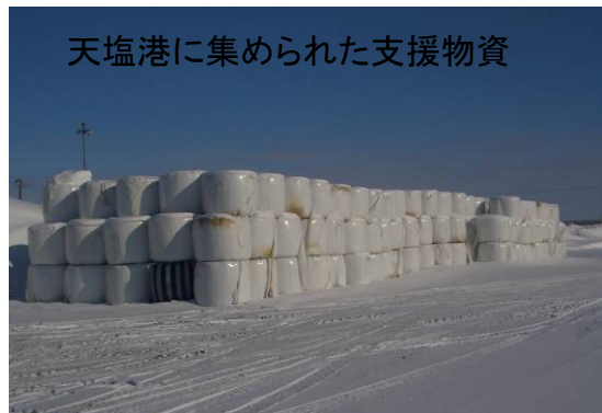
天塩港に集められた支援物資