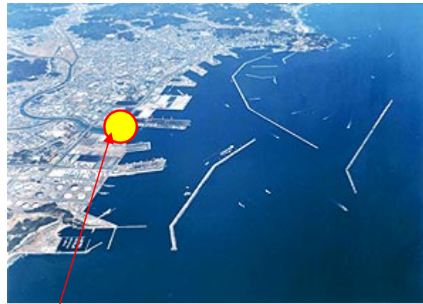
小名浜港荷卸箇所 藤原ふ頭第1号岸壁(-10m)