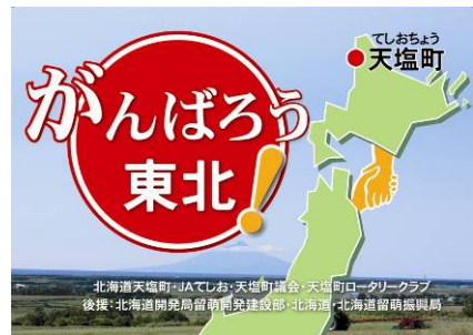
支援物資に貼られるステッカー