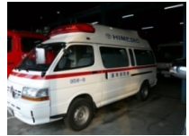
留萌消防組合消防本部