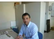
NPO法人留萌観光協会 海東事務局長