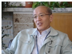
留萌市 高橋定敏市長