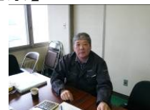
新星マリン漁業協同組合 布施参事