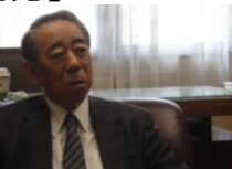
留萌商工会議所 対馬副会頭