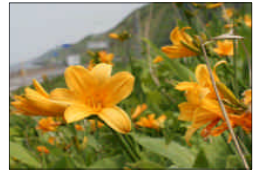
エジカンゾウ(小平町)