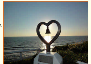
ハートのモニュメント