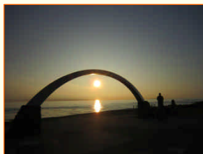
トワイライトアーチ