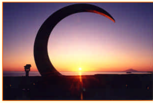
風と夕陽のモニュメント