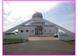
しょさんべつ天文台 (初山別村)