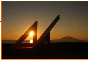
北緯45度モニュメント