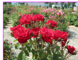
はぼろばら園 (羽幌町)