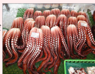
日本海の荒波で育まれ味も格別