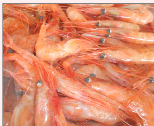
新鮮な甘エビを召し上がれ!

全道一の漁獲量です。留萌管内各地で特産品となっており、中でも留萌沖の好漁場「武蔵堆」で獲れる甘エビは全国的にも有名です。羽幌町にはエビにちなんだご当地グルメがあります。