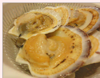
ぷりぷりの食感です

留萌管内はホタテ稚貝の主要産地で道内外に出荷されています。地元産のホタテは小売店や直売所で買い求めることができます。留萌の人には身近な海産物で、炭焼きをする時にはかかせません。