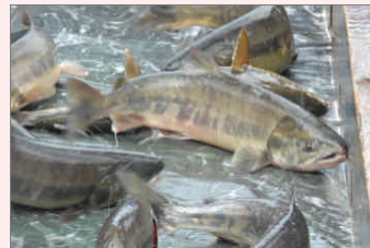
イクラも美味しいですよ

留萌で獲れるのはシロサケという種類で、秋に生まれた川の沿岸に産卵のために戻ってくるサケです。増毛町の暑寒別川は秋になると、数万匹ものサケが遡上します。