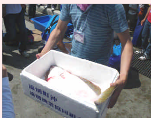
ひらめ底建網オーナーin遠別の様子

遠別町ではひらめ底建網オーナーin遠別を開催。全国からオーナーへの応募がありました。