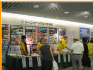
たくさんの方が訪れました。

◇7月21日に札幌駅前通地下歩行空間で、萌える天北オロロンルートと留萌管内のPRを行いました。