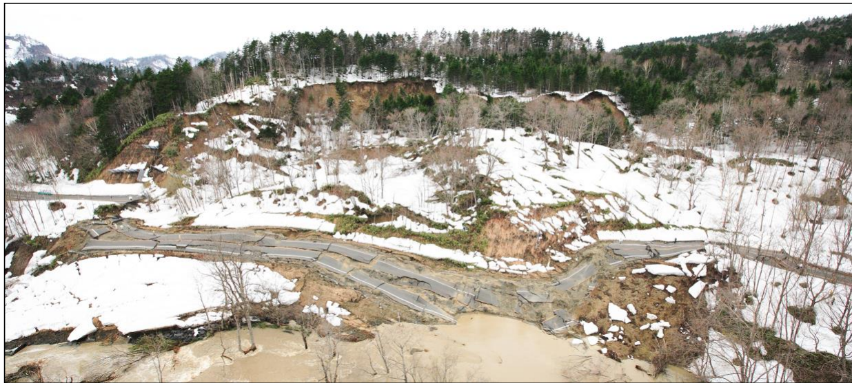
【地すべり被災状況(平成24年4月)】