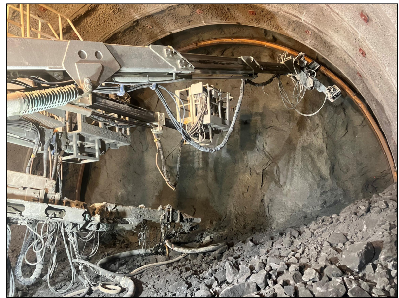
【((仮称)苫前トンネル掘削 施工状況(令和6年8月)】