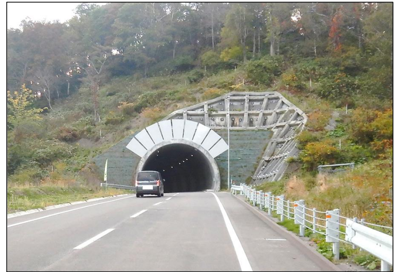
【霧立峠トンネル 開通状況(令和6年10月)】