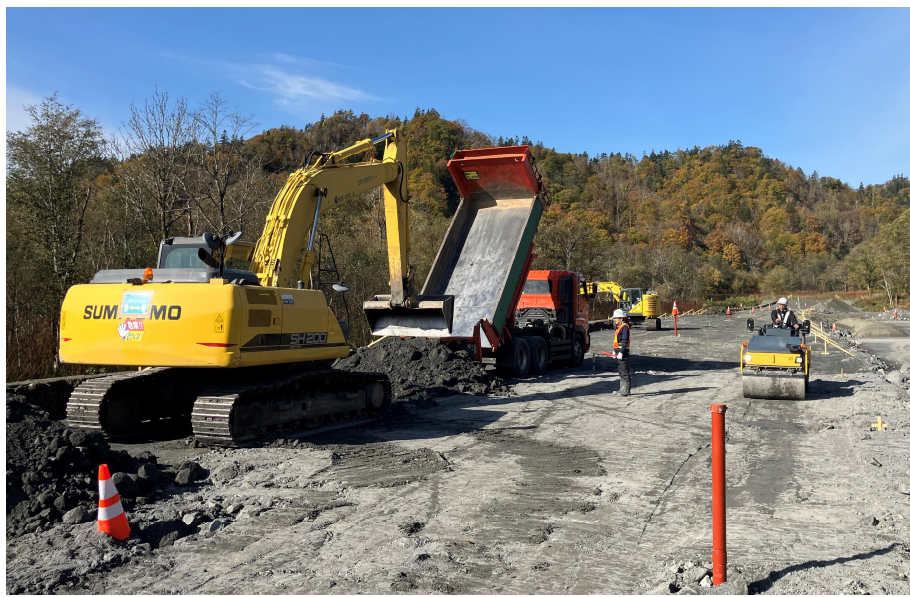
【盛土工 施工状況(令和6年10月)】