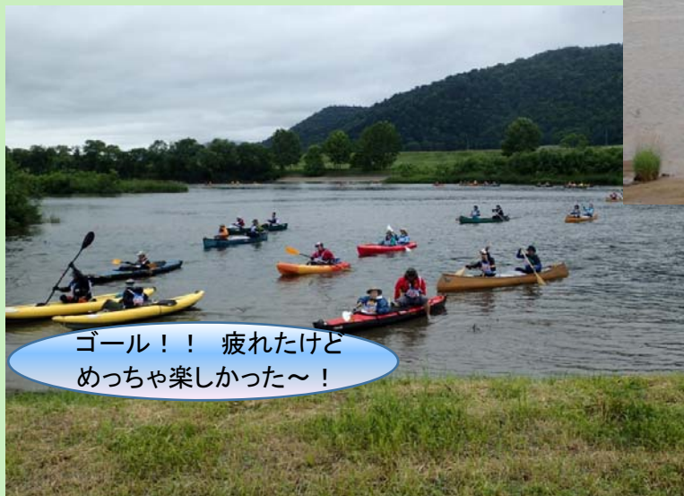
↑ 今年のゴールは音威子府村！ みなさんお疲れ様でした。