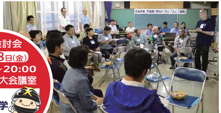
※「新しい会」…アイデア実現のため、資金集めや他団体との連携に向け代表や規約を設けた会