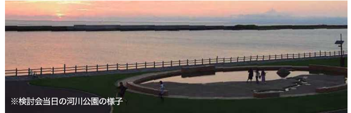
※検討会当日の河川公園の様子

全体での話し合いに久しぶりにたっぷり時間を使いました。各メンバーの持つ様々なノウハウや情報を共有できるので、このやり方は今後大切だと実感しました。