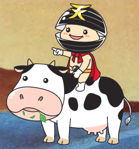
題字背景・イラスト画: sakko