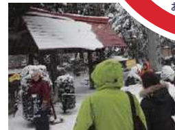
駆け足ながらも密度濃い交流ができました。